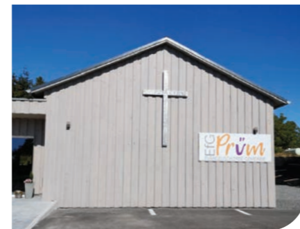
Außenansicht vom Neubau