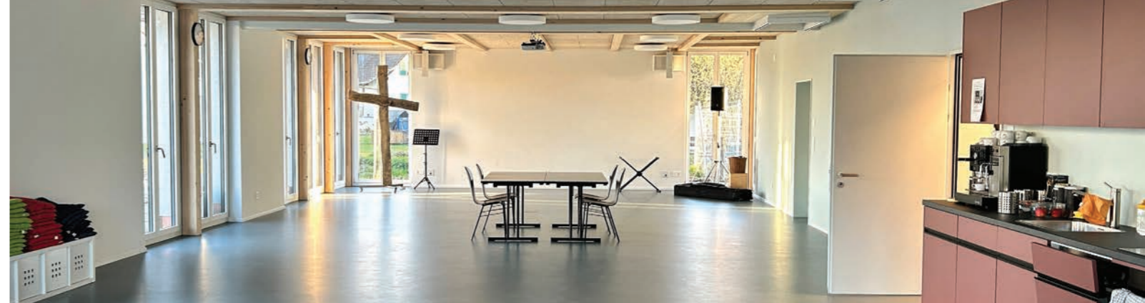
Erweiterter neuer Speisesaal

Besonders bewegend war die Unterstützung durch andere ETG-Gemeinden: So reisten beispielsweise Teams aus der Lindenwiese und Neuhütten an und halfen eine Woche lang tatkräftig auf der Baustelle mit.