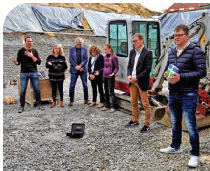
Spatenstich: Gemeindeleitung legt geistliches Fundament

Das neueste Bauprojekt der Buchwiesengemeinde ETG Erlen ist ein Meilenstein für die Entwicklung der Thurgauer Gemeinde. Die neuen Räume für die Kinder und auch der Speisesaal mit der Terrasse sind einladend und tragen dazu bei, dass Groß und Klein sich wohl und willkommen fühlen.